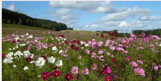
太陽の丘えんがる公園 (遠軽町)