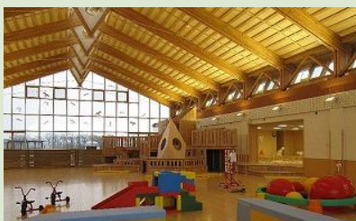
オホーツク流氷公園 (紋別市)

「楽しみの場所」、「にぎわいと参加の場所」など4つのそれぞれ異なった体験のできる公園。