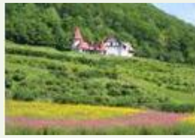
ハブガーデン (滝上町)

7月から9月まで4万㎡の敷地に約300種類のハーブが咲き、やさしい香りに包まれます