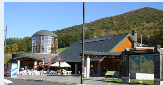
道の駅サロマ湖 物産館みのり (佐呂間町)

サロマ湖の特産品「北海シマエビ」(7月)をはじめオホーツク沿岸の特産品を品揃え。