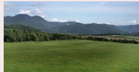
天狗平 (遠軽町白滝)

なだらかな緩斜面が広がるこの天狗平は、200万年以上前の火砕流によってできている！