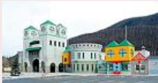
ちゃちゃワールド・影絵美術館 (遠軽町生田原)