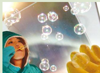
道立オホーツク流氷科学センター「GIZA」(紋別市)

視界360度の円形ドームで迫力のある映像を映し出すアストロビジョンや観測室など。