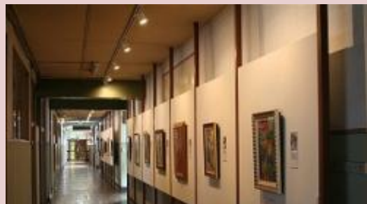
マウレメモリアルミュージアム (遠軽町丸瀬布)