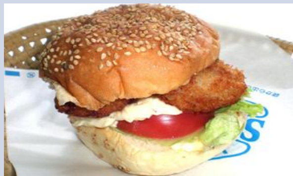
ホタテバーガー (佐呂間町)

サロマ湖のホタテが3つも入り、タルタルソースとの相性がぴったりのバーガー。佐呂間の隠れグルメです。