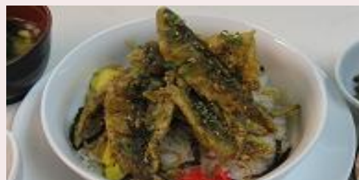
オホーツク・遠軽地産地消ランチ (遠軽町)

やまべ、じゅんさい、アスパラ、枝豆等、遠軽町の特産品とオホーツクの食材を組み合わせた旬のメニュー