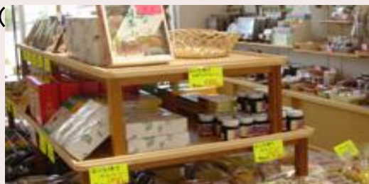
太陽の丘えんがる公園レストハウス