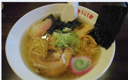
ゆうらく軒 (湧別町)

念館「湧楽座」に併設されたラーメン専門店。昭和の歴史を感じながら、こだわりの味が楽しめる異空間。