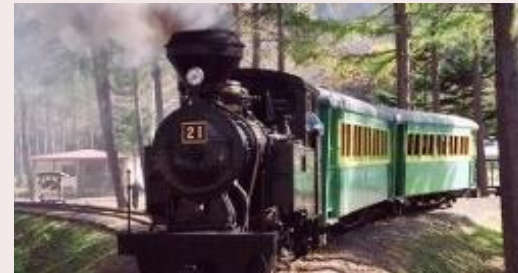
いこいの森雨宮21号 (遠軽町丸瀬布)