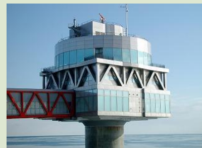
氷海展望塔オホーツクタワー(紋別市)

視界360度の円形ドームで迫力のある映像を映し出すアストロビジョンや観測室など。