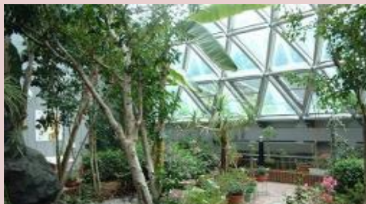
いこいの森昆虫生態館 (遠軽町丸瀬布)