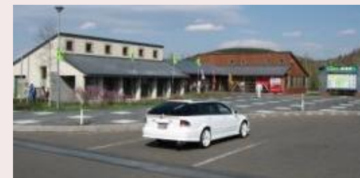
道の駅しらたき (遠軽町白滝)

オホーツク圏への玄関口となる道の駅。自家製麦・天然酵母パンや地元そば粉を使用した蕎麦、白滝の缶詰商品など