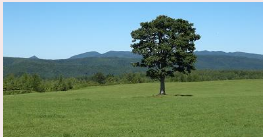
太平高原 (遠軽町丸瀬布)

ぐるっと360度のパノラマが広がる高原。牛の放牧や牧草ロールなどの風景がおすすめ