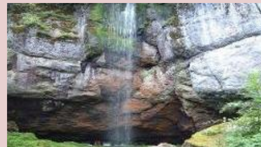
山彦の滝 (遠軽町丸瀬布)