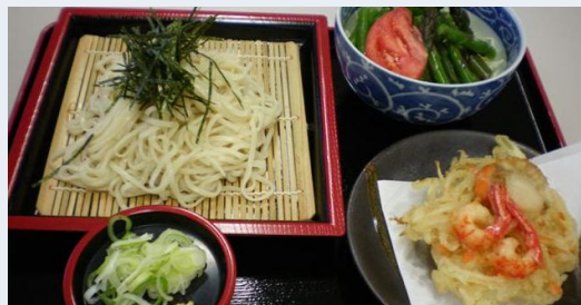
道の駅かみゆうべつ温泉 チューリップの湯

道産100%小麦を当館の温泉水だけで練りこんだざるうどん。つけあわせに湧別産の玉葱、北海シマエビのかき揚げ