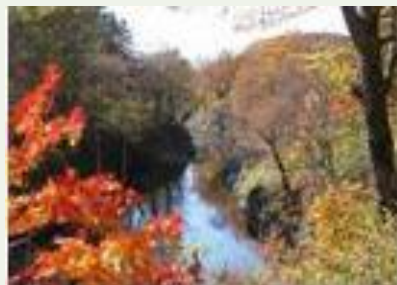
渓ウォーキング (滝上町)