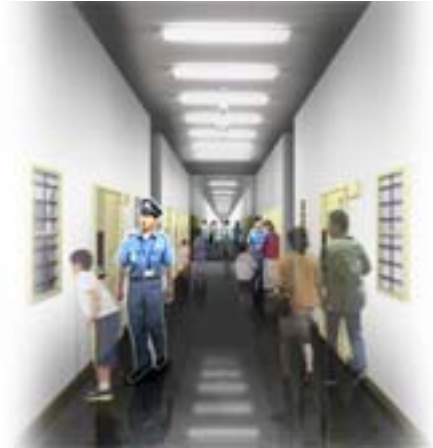
現在の共同室と単独室 イメージ