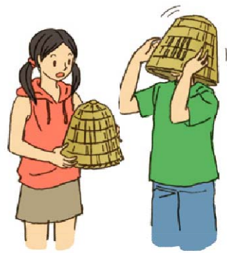
網笠体験 イメージ