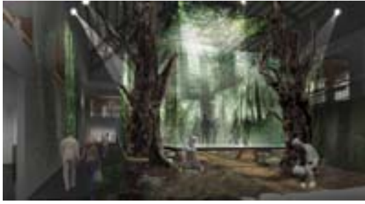
日本初の大迫力「体感シアター」 赫い囚徒の森—知られざる220kmの苦難 イメージ