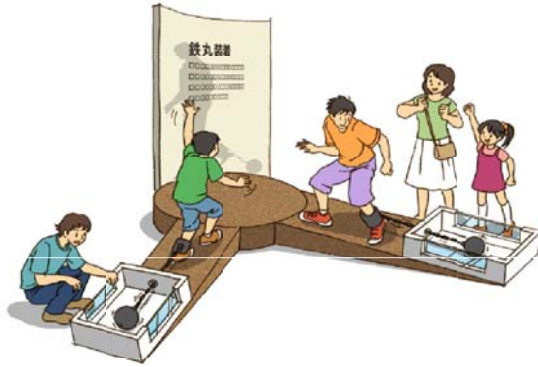
鉄丸体験 イメージ